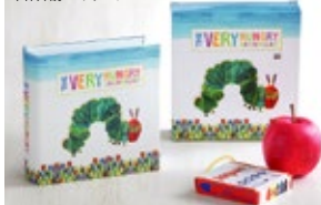
本体外観・パッケージ