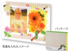
写真を入れたイメージ

本物のお花に「はらぺこあおむし」がとまってひと休みしているようなフォトフレーム。アクリル板の前後に異なるイラストを配置することで、平面の絵に3Dの奥行きを感じることができるデザインです。