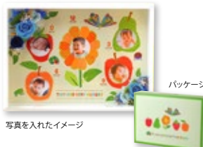
写真を入れたイメージ